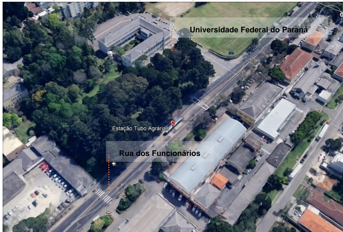
Figura 2: Implantação Estação Protótipo Agrárias - infraestrutura existente