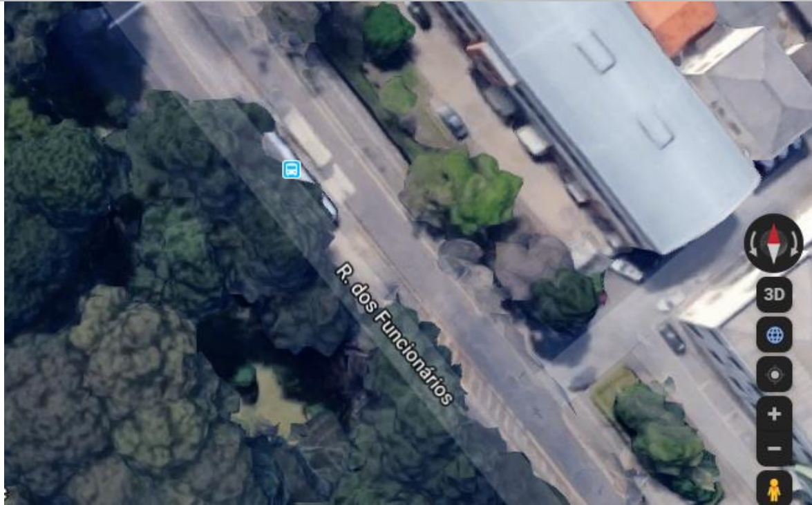
Figura 5: Estação Protótipo Agrárias – Posicionamento em relação ao norte