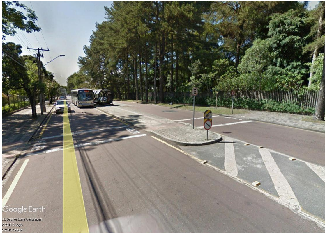
Figura 3: Estação Protótipo Agrárias - infraestrutura existente